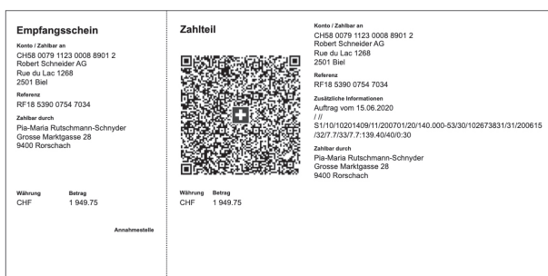
Variante 3: QR-Rechnung mit Creditor Reference und IBAN (neue Nutzungsmöglichkeit)

QR-Rechnungen können in ein paar einfachen Schritten am eigenen Computer erstellt und gedruckt werden. Da-